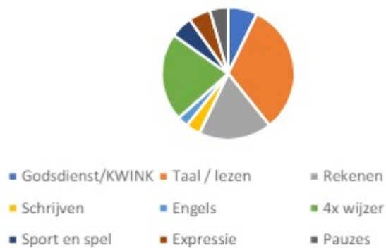
Uren per week

Op onze school willen we de leertijd effectief en efficiënt besteden, omdat we beseffen dat leertijd een belangrijke factor is voor het leren van onze leerlingen. We proberen daarom verlies van leertijd te voorkomen. Ook plannen we weloverwogen voldoende leertijd voor de verschillende vakken, zodat de leerlingen zich het leerstofaanbod eigen kunnen maken.